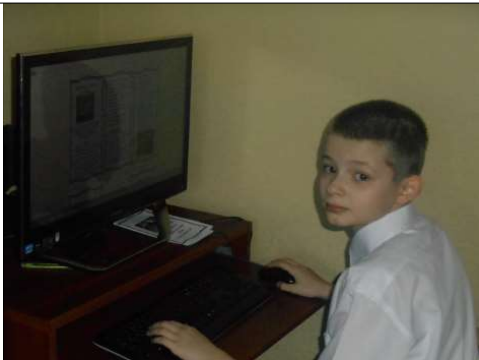
Создание буклета «Как правильно вести себя в Храме».