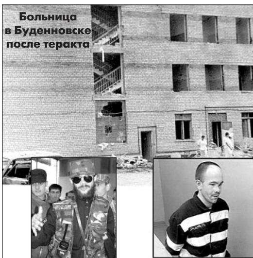
Радуев до Кизляра и после...

Потом были другие многочисленные кровавые теракты. Но у событий в Буденновске и Кизляре — особый трагизм. Поэтому их называют первыми горькими уроками борьбы с террором в России. Они показали звериную сущность людей, которые добиваются своих политических целей человеческими средствами.